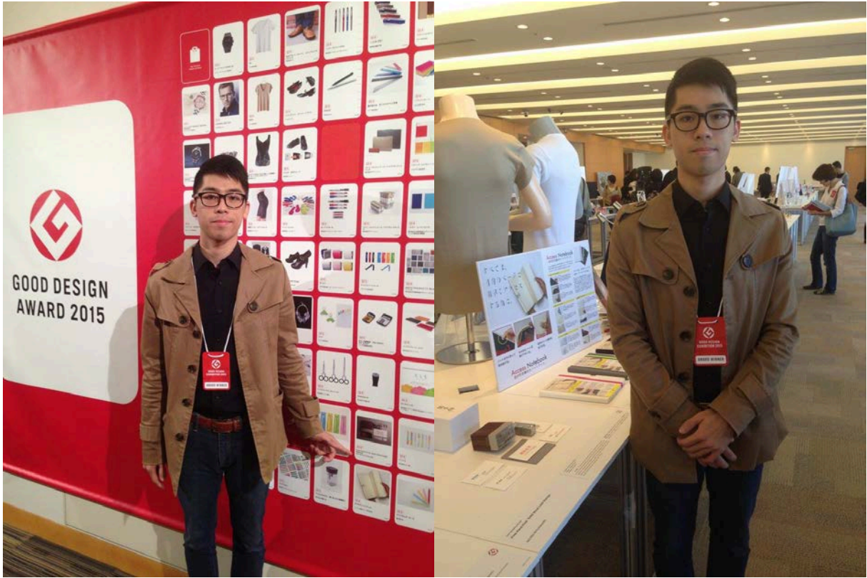
Good Design Award 2015 : https://goo.gl/ofQAXR